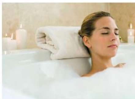
Entspannend: die Badewanne in jedem Stadthaus