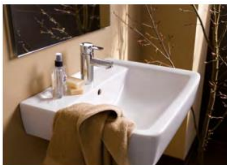
Zeitlos puristisch: die Sanitär-Ausstattung