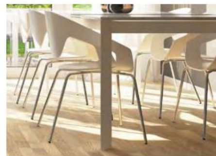
Klassisch und langlebig: das Holzparkett